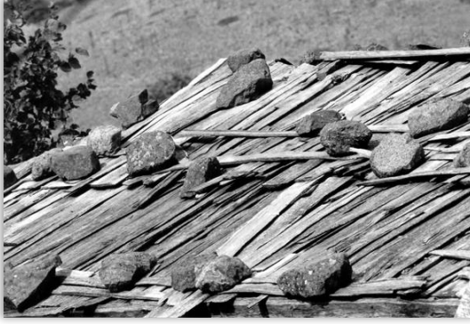
Bedevra Kaplanmış Xardama

Çatılar bedevra 6 ile kaplanır. Böyle kaplanmış çatıya da ‘xardama’ adı verilir.