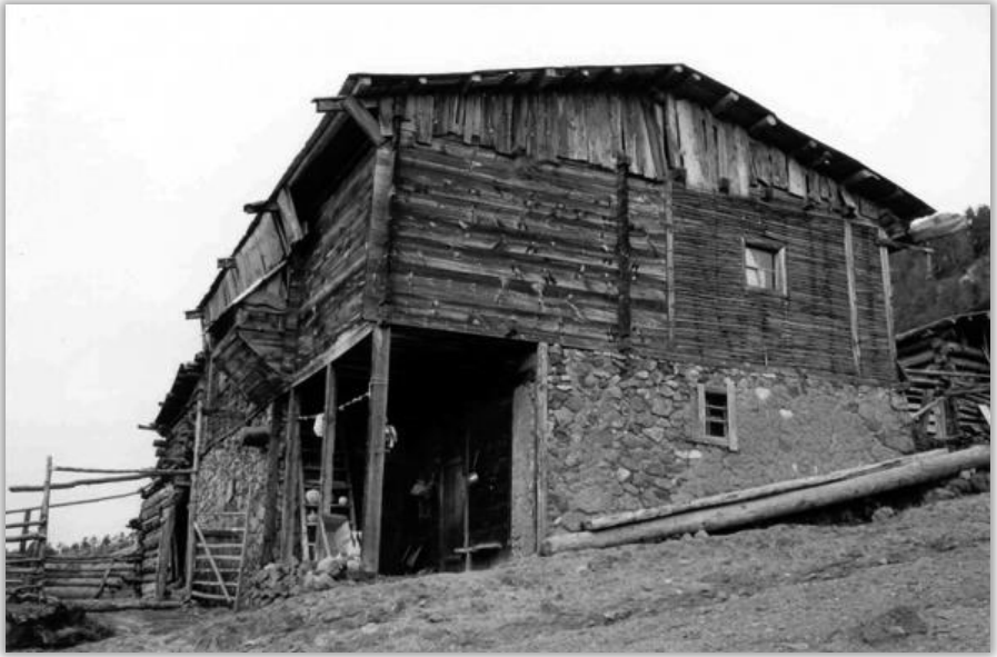
Tipik Bir Xod Evi (© BK)

Bu anlamda Xod'un tümüyle kendine özgü bir mimarisinden söz etmek mümkün görünmemektedir. Çevredeki herhangi bir köyle büyük oranda benzerlik gösterir.