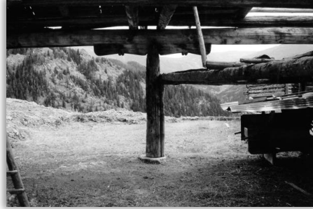
Yarı Kapalı Harman

Üst katın dış duvarları değişik biçimlerde olabilir. Xod'da en yaygın olarak çakatura 2 kullanılır. Aynı katta bulunan ambar ise kalın ve sağlam tahtalarla inşa edilir ve özellikle zararlı hayvanların girmesini engellemek için eşik yaklaşık 30-40 cm kadar yüksek tutulur. Ayrıca ambar dışında üst katta 1-2 oda ve genişçe çardak bulunur. Çardağın açık bir bölümünde dışa doğru 2 veya 3 tarafı peykeyle çevrilmiş bir koşki 3 olur. Bazı evlerde ise dışa doğru böyle bir bölme yapılmayıp çardağın bir tarafı bu amaçla kullanılır. 4 Evin bitişiğinde veya yakınında genellikle harman, onun yanında da merak 5 yer alır.