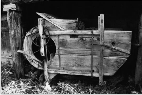
Harman Makinesi

Samanın ekinden ayrılarak savrulması da uzun ve yorucu bir iş sonucu gerçekleşebilmekteydi. Böyle günlerde esintinin yetersizliği kadar çok sert olması da işi engellemekteydi.