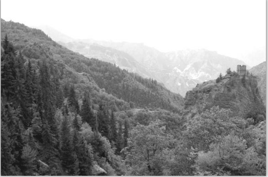
anzagara Kalesi ( BK)

Kuşaktan kuşağa aktarılan anlatılara göre de bu kalenin bir karşı kalesiyse şu anki anzagara mezarasının kaleye bakan yamacında kurulmuş ancak zamanla yıkılmış. Bugün bile sözü edilen yamaçta belli taş kalıntıları bulunmaktadır. Fotoğrafta görülen soldaki yamacın ortasındaki toprak/kaya çıkıntısı bu anlatımı destekler niteliktedir.