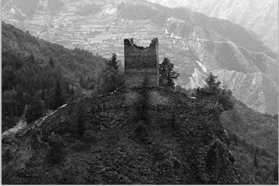
Tanzagara Kalesi ve (arkada) Xozabir

Bugün açısından bakıldığında bu mesafenin uzunluğu hem anlaşılmaz görünebilir hem de bir yanılısamaya yol açabilir. Oysa her kervan ya da küçük ölçekli taşıyıcı grubunun bu yolu baştan sona geçtiği düşünülmemeli. Donanımı ve taşıyıcı kapasitesine göre bu işlemin belirli aralıklarla başka taşıyıcılara aktarılarak yapıldığını kabul etmek daha akla yatkın bir açıklamadır. Zaten bir devenin dağ, bir eşeğin de çöl şartlarında aynı verimlilikle iş göremeyeceği, bu durumu açıklamaya yardımcı olur. Çoğu zaman İpek Yolu kavramı bugünkü, bilmem hangi otoyolun izlediği hat gibi algılanabilir. Ancak bu anlamda mevsime ve o dönemdeki öteki şartlara göre kısmen farklı rotaların izlenebileceğini var saymak kavramayı kolaylaştıracaktır.