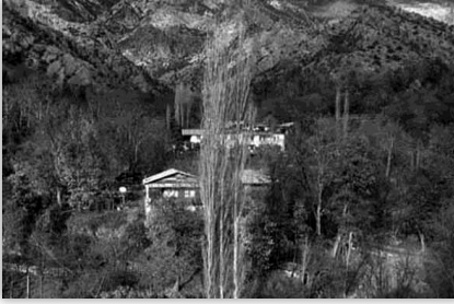
Xezor (© AD)

Muhtemelen Xod'un da kendine özgü kodları ve (uzak ya da yakın) öteki yerlerden farklılıkları bulunmaktadır. Bu farklılıklar hangi boyutta incelendiğiyle ilgili olarak görünür olabilir. Xezor (şimdiki adı Hızarlı), Bakt (şimdiki adı Dikmenli), Vartxel (şimdiki adı Meşeköy), Oğdar (şimdiki adı Günyayla), Xers (şimdiki adı Kirazalan) gibi yakın çevresindeki bazı köylerle içeriden bir kıyaslama yapıldığında birçok farklılık görülebilir.